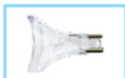
Punta Aceleradora para Blanqueamiento Dental