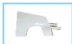
Espaciador LLLT Low Level Laser Therapy